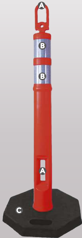
Poste delimitador con apertura, reflejante y base negra